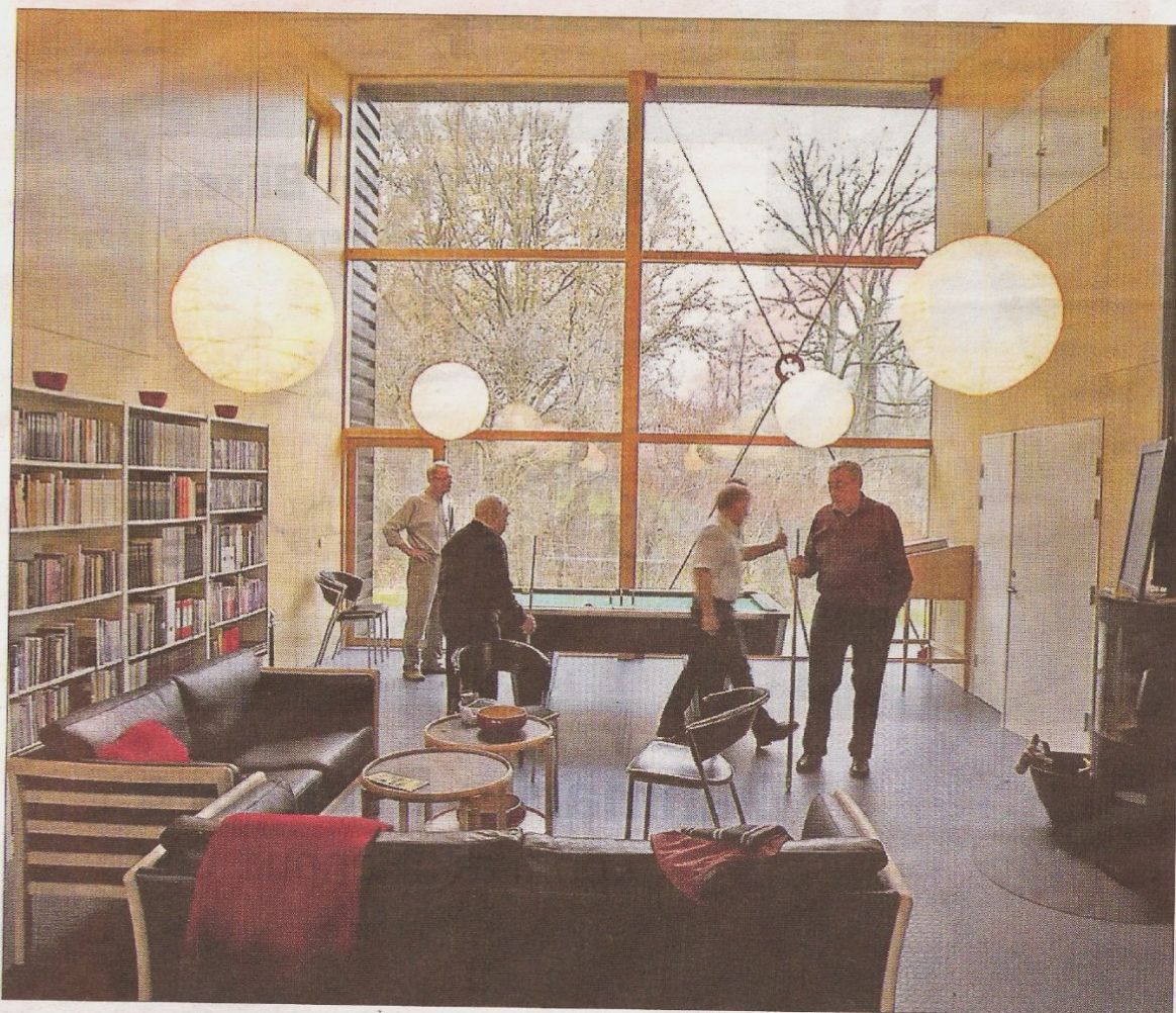
Fælleshuset på Egebakken er centrum for beboernes fælles aktiviteter.