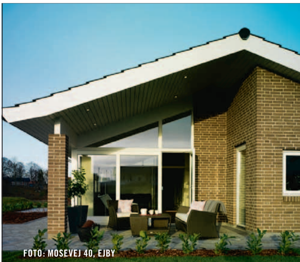
FOTO: MOSEVEJ 40, EJBY

■ Læs mere om seniorbofællesskabet på www.egebakken.dk