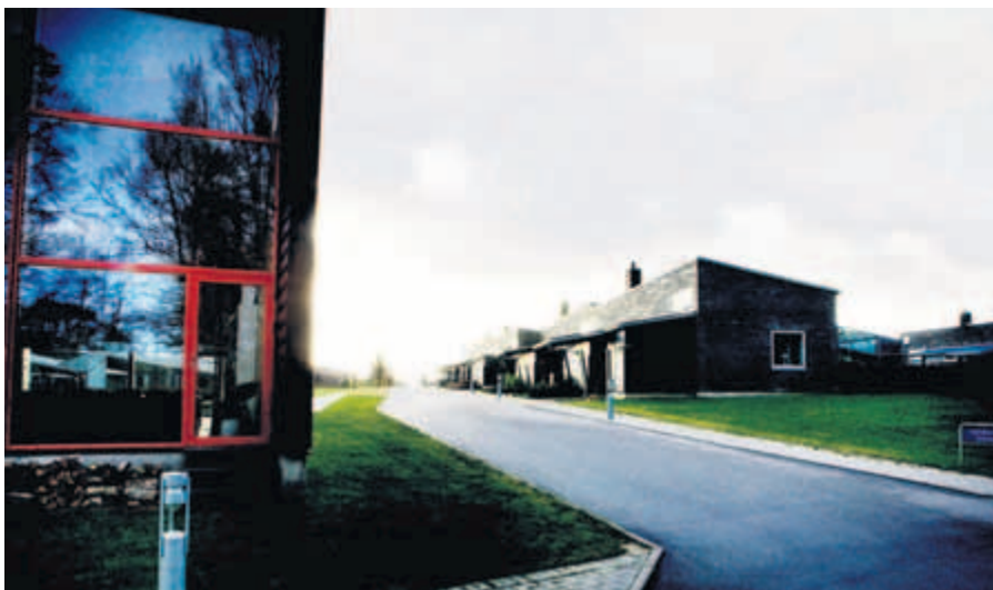
En af husrækkerne i Egebakken med fælleshuset Kikkerten i forgrunden.